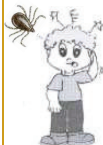
DOR DE CABEÇA

Esses sintomas podem aparecer a partir do 2º até o 14º dia após a exposição.