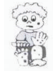
PONTINHOS AVERMELHADOS NAS MÃOS E PÉS

NESSE CASO PROCURE A UNIDADE DE SAÚDE MAIS PRÓXIMA DE SUA CASA