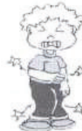
DOR NO CORPO