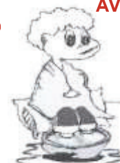
FEBRES E CALAFRIOS